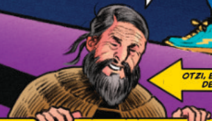
OTZI, EL HOMBRE DE HIELO